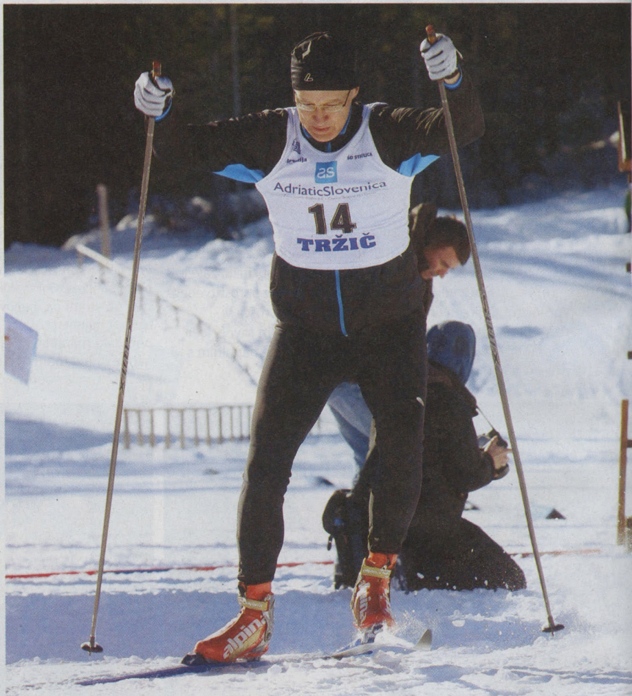
Igor Lukšič, nekdanji minister za šolstvo in šport

Tudi letos je imela prireditve dobrodelno noto. S pomočjo udeležencev, sponzorjev in donatorjev so organizatorji zbirali finančna in materialna sredstva, s katerimi so osrečili dve socialno ogroženi slovenski družini. Poleti bodo člani Športnega društva Strelca z izletom v sredogorje počitnice polepšali še stotim otrokom.